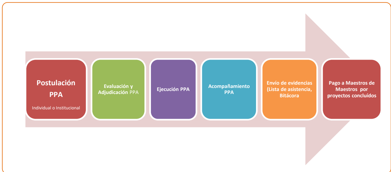
Diagrama “Etapas del proceso de implementación P.A.A”